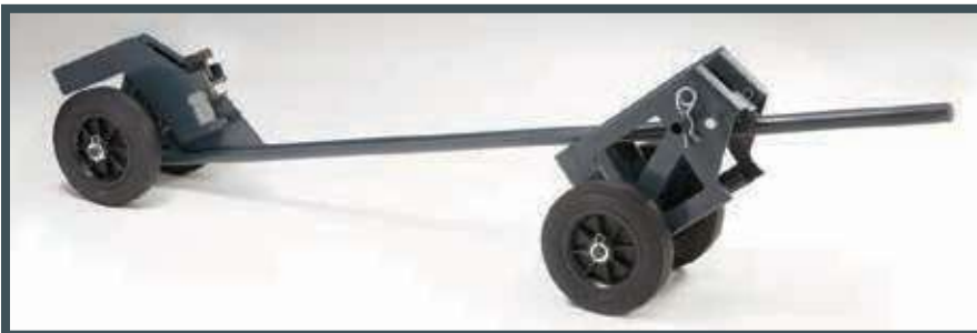
• Der Handtransportwagen