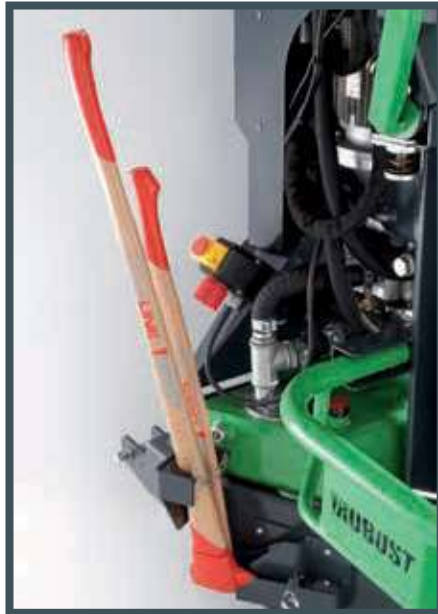
• Der Axt- und Spaltmaschinenenträger