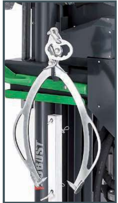
• Spaltholzmaschinenzange und Zangenträger