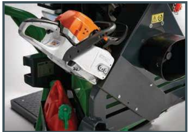
• Der Sägeträger