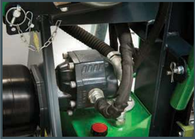
• Gusseisen Pumpe