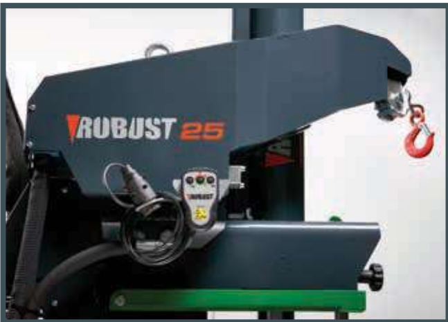
• Die Hydraulikholzspaltmaschine (540 kg, 15 oder 20 m) – mechanische oder Fernsteuerung