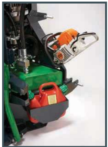
• Der Kanister Träger