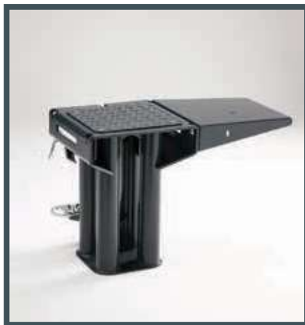
• Spalttisch für kürzere Holzscheite und Feuerholze, die Verbreiterungsmöglichkeit